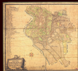
mapa Kutné Hory, 1813