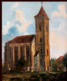
kostel P. Marie Na Náměti, 1839

Archiv obsahuje na jeden tisíc obrazových pramenů. Náhledové snímky a reprodukce jsou seřazeny podle objektů, domů a ulic, dále chronologicky podle data vzniku. Zámek o kvalitní reprodukci najde odkaz na vlastníka originálu a archiv bude pravidelně doplňován o přírůstky. Na internetových stránkách najdete další informace o projektu, všech jeho součástech a využití v praxi.