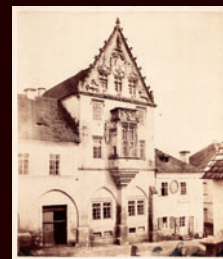
Kamenný dům, 1856