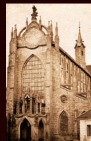
chrám Nanebevzetí P. Marie v Sedlci, 1865