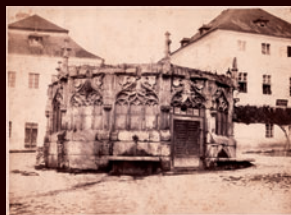
Kamenná kašna, 1856