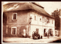
zaniklý dům č.p. 240 Česká ul., 1904