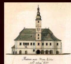
zaniklá radnice, 1900