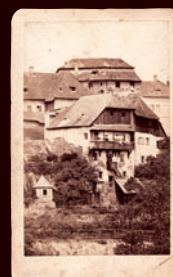
domy č.p. 12 a 13 Ruthardská ul., 1870